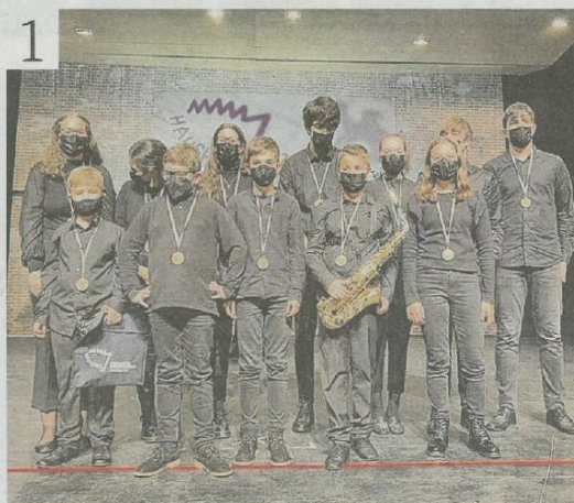
Los acordeonistas cedeireses triunfaron en el Festival de Mondragón.

3 La Asociación Sociocultural ASCM celebró el pasa-