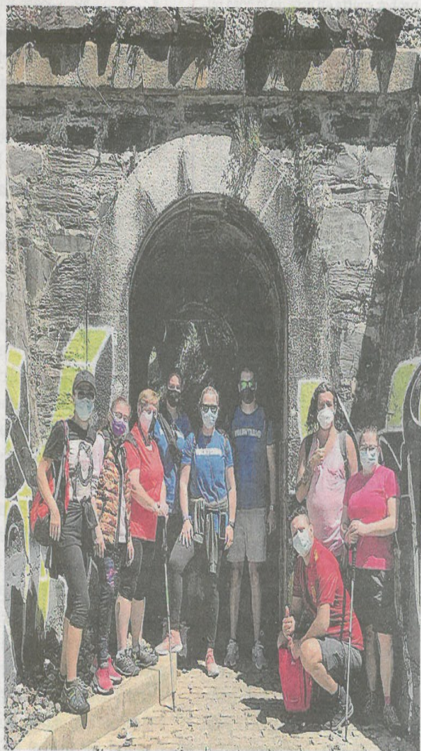
Los voluntarios de la asociación realizaron la primera etapa.

Desde la entidad explican que en el caso de su colectivo no encuentran barreras físicas para la realización del Camino, sino que se dan de bruces «con las mismas barreras comunicativas» a las que se enfrentan a diario y «la consecuente dificultad de acceso a la información en caso de necesitarla».