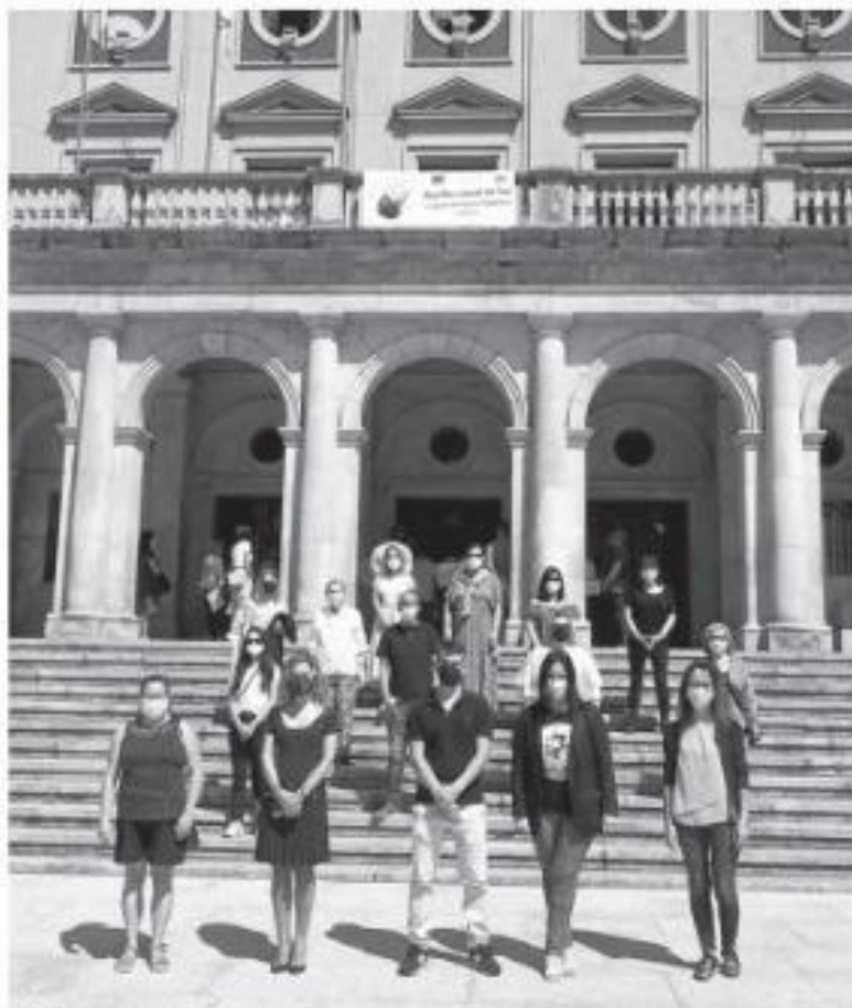
Celebraci n institucional del a o pasado | AEC-J.M.

Los actos programados para el d a 14 incluyen una recepci n institucional en el Concello de