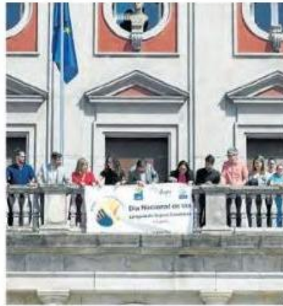
La asociación AXF llevó a cabo distintos actos en los municipios de Ferrol y Narón

Los representantes de la entidad también fueron recibidos en el Concello naronés, donde, además, ya por la tarde se trasladaron a la plaza de A Gándara para