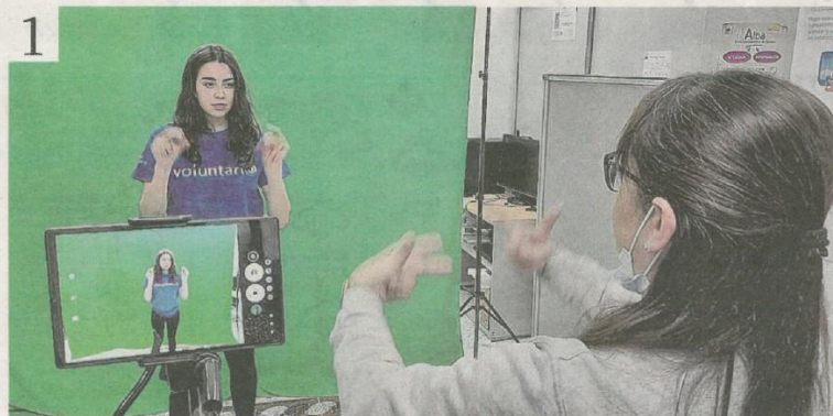
Los alumnos del colegio La Salle aprendieron lengua de signos para contar ante las cámaras el cuento.