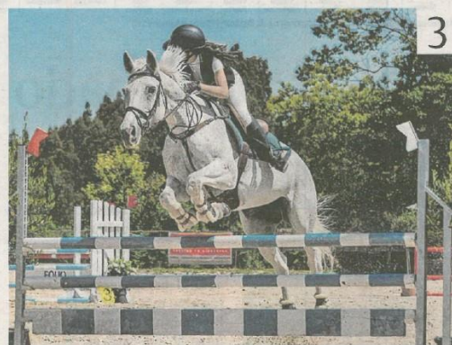
Las instalaciones del club Equo Alalma en Brión acogieron la prueba.

publica «lo que se espera de Francisco Narla». «Es fundamental que el escritor escriba aquello que le gustaría encontrar en las estanterías, con lo que en ese sentido cumpla al 100 %». Seguro que será un nuevo éxito.